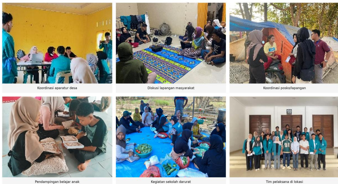
Gambar 1. Dokumentasi Kegiatan Koordinasi, Pendampingan Masyarakat, Sekolah Darurat, dan Tim Pelaksana

Sekolah darurat dilaksanakan sebagai respons terhadap kebutuhan pendidikan anak pascabencana. Program ini dilakukan melalui pengenalan konsep pembelajaran dalam situasi darurat, penyusunan materi sederhana, kegiatan belajar ramah anak, serta edukasi mitigasi yang disesuaikan dengan usia anak (Isnaini, 2022). Guru dan pengelola RA juga memperoleh penguatan kapasitas dalam mengelola pembelajaran darurat serta memberikan dukungan psikososial kepada anak.