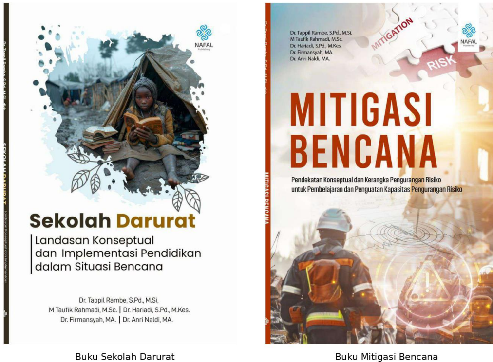
Gambar 4. Produk Luaran Buku/Modul Pengabdian: Sekolah Darurat dan Mitigasi Bencana

SOP evakuasi menjadi dokumen penting yang dapat digunakan oleh pemerintah desa dan tim siaga bencana. SOP ini memudahkan koordinasi dan mengurangi potensi kebingungan saat bencana terjadi. Media edukasi berupa poster dan infografis mendukung penyebaran informasi kebencanaan kepada masyarakat. Produk-produk tersebut bersifat sederhana, aplikatif, murah, dan dapat digunakan berulang (Putro et al., 2024).